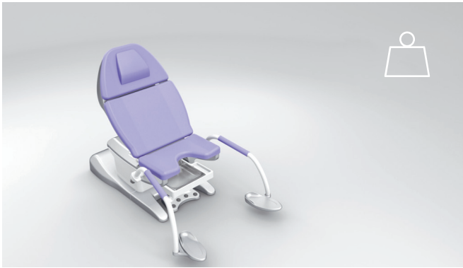
9. Carico di lavoro sicuro pari a 300 kg