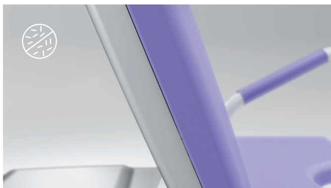
7. Verniciatura e imbottitura antimicrobiche