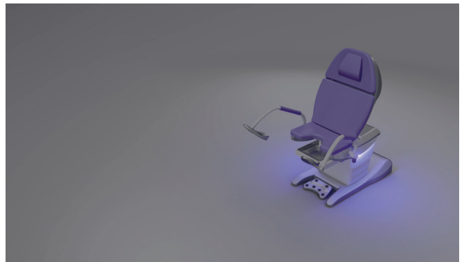
14. L'illuminazione ambientale può essere adattata al design dello studio e utilizzata come avviso di pulizia.