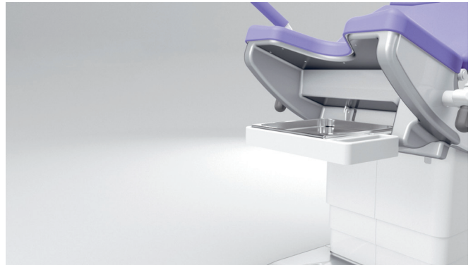
12. Vaschetta raccogli-liquidi sempre automaticamente in posizione orizzontale