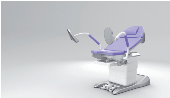
11. Funzione Memory: numerose posizioni di visita memorizzabili individualmente