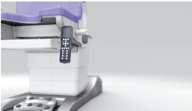
13. Pulsantiera con display e supporto orientabile