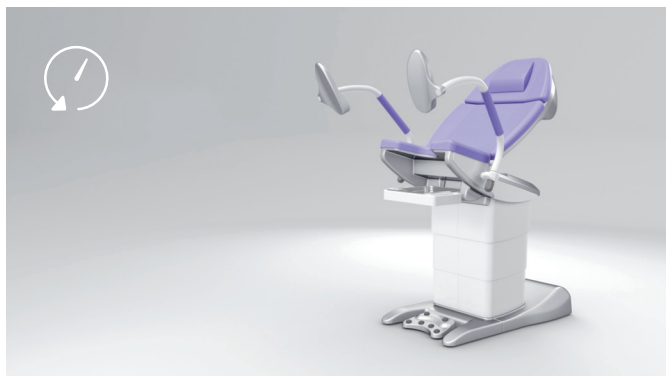
4. Risparmio di tempo grazie alla moderna tecnologia di azionamento