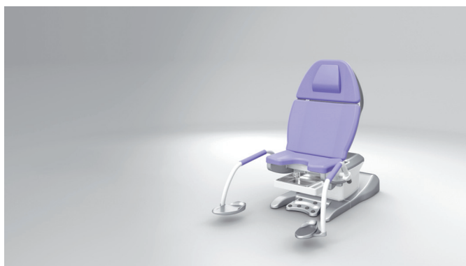
2. Comoda posizione iniziale in grado di definire nuovi parametri!