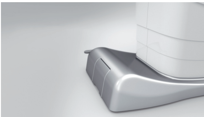
15. Massima resistenza grazie all'uso dei più moderni materiali plastici ABS