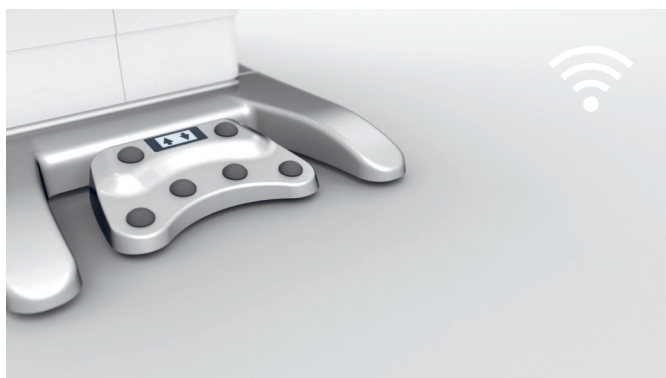
6. Controllo mediante tecnologia wireless I