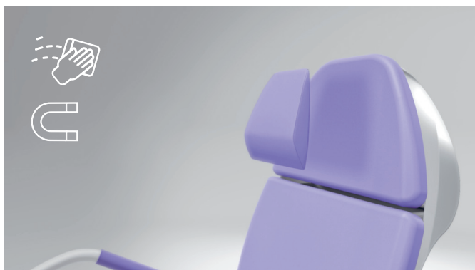
8. Fissaggio magnetico comodo e igienico del cuscino poggiatesta