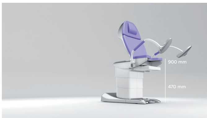
1. Valori unici di regolazione in altezza