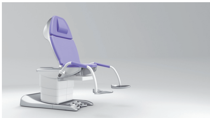
3. Posizione di seduta eretta eccezionalmente comoda