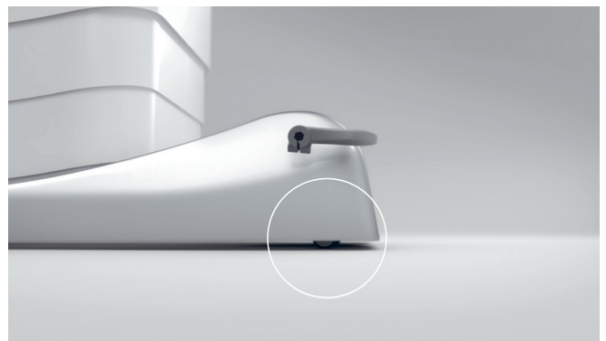
16. Flessibilità garantita dalla mobilità