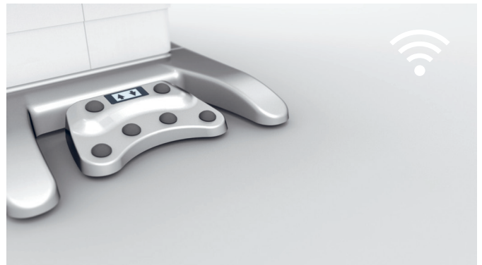
6. Steuerung via Wireless Technologie