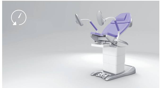
4. Zeitersparnis durch modernste Antriebstechnologie