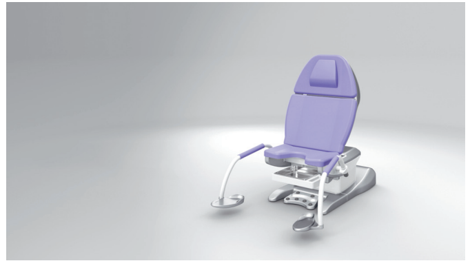
2. Komfortable Ausgangsposition setzt neue Maßstäbe